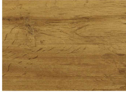
0LC52579 / 米蘭棕橡木