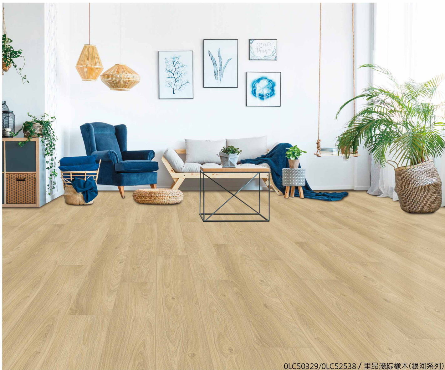
OLC50329/OLC52538 / 里昂淺棕橡木(銀河系列)