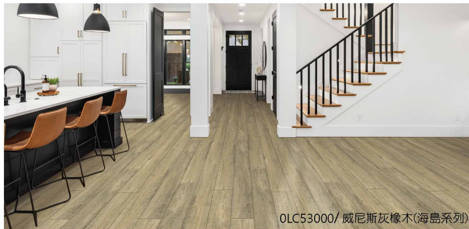
OLC53000/ 威尼斯灰橡木(海島系列)