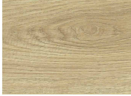
0LC52571 / 雨林淺棕橡木