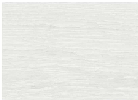
OLC52353 / 克林姆白橡木