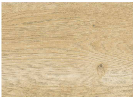
OLC52355 / 北歐淺棕橡木