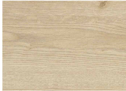
01C52341 / 自然淺棕橡木