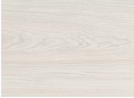
0LC52575 / 冰島白松木