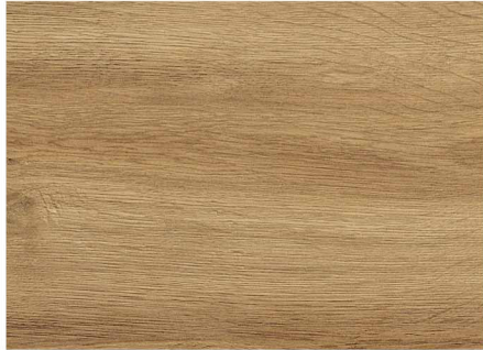
01C52344 / 雨林棕橡木