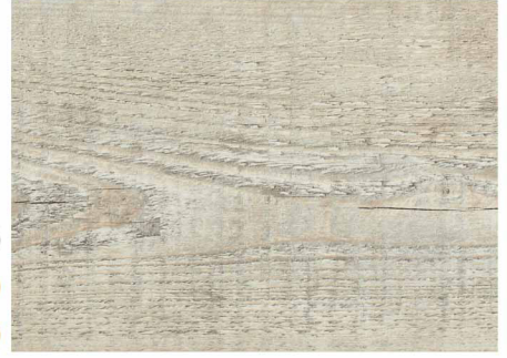
0LC52574 / 北歐淺米松