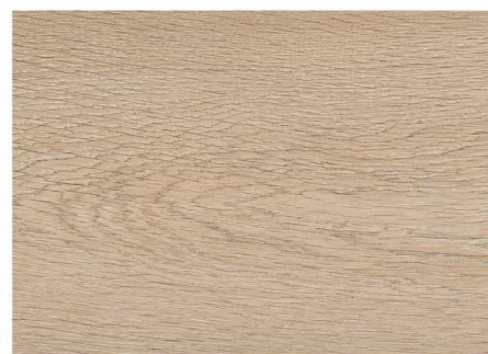
OLC52375 / 馬爾地夫棕橡木