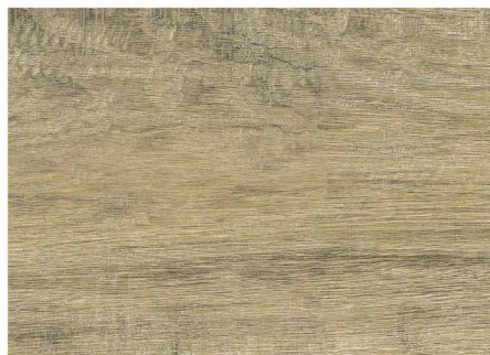
OLC53000 / 威尼斯灰橡木