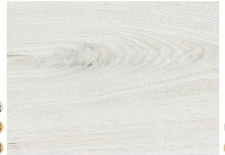
01C52352 / 丹麥白橡木