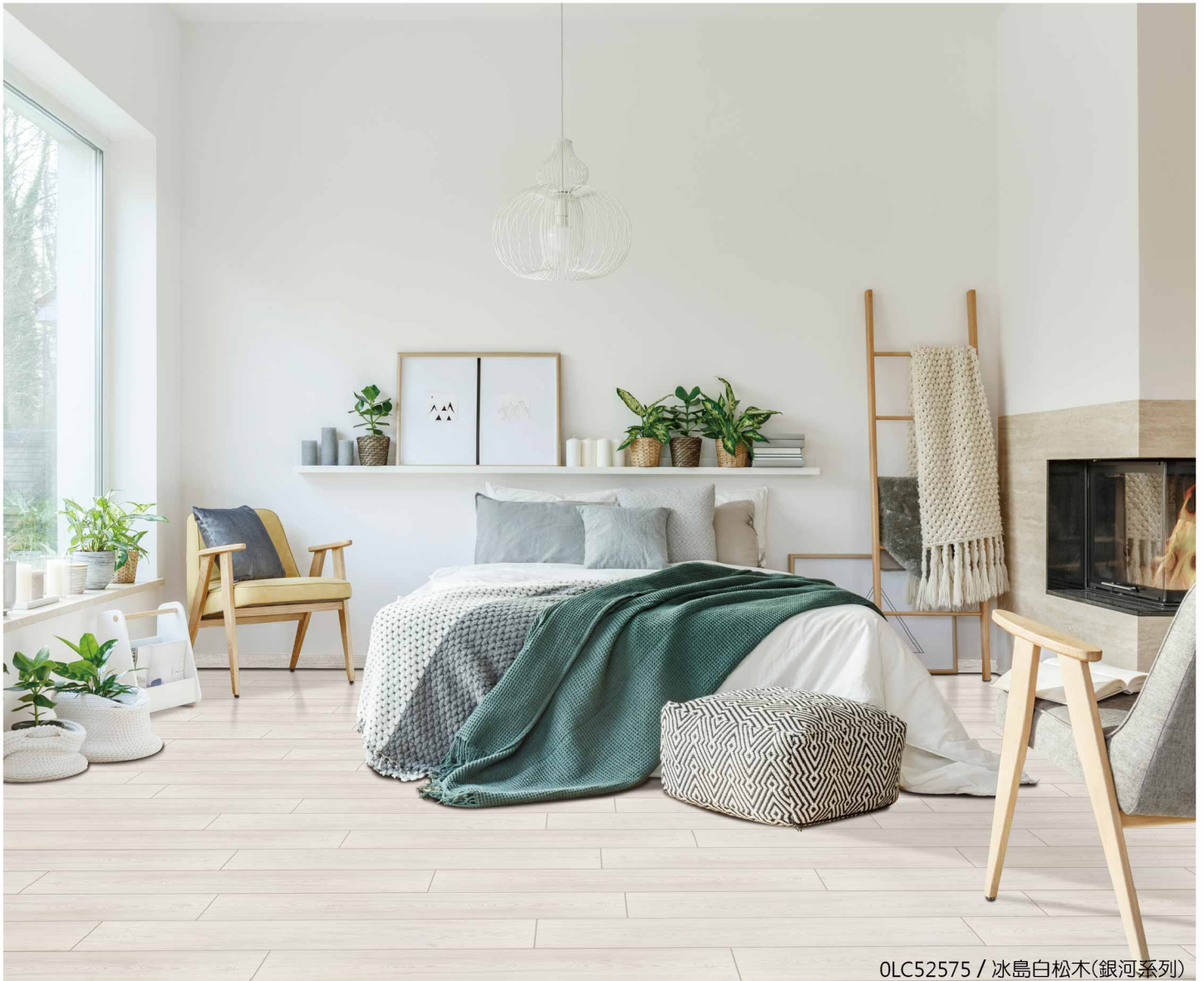
0LC52575 / 冰島白松木(銀河系列)