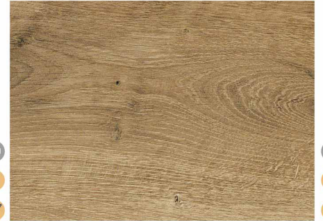
01C52347 / 自然灰橡木