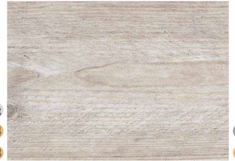
01C52342 / 克林姆灰松木