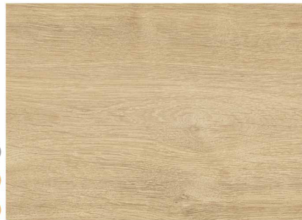
01C52351 / 馬爾地夫淺橡木