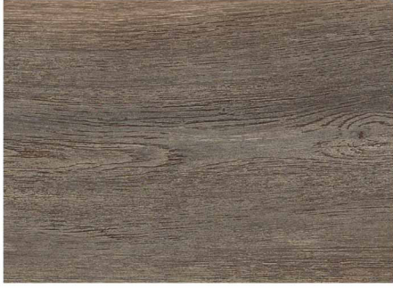
0LC52539 / 波本刷灰橡木