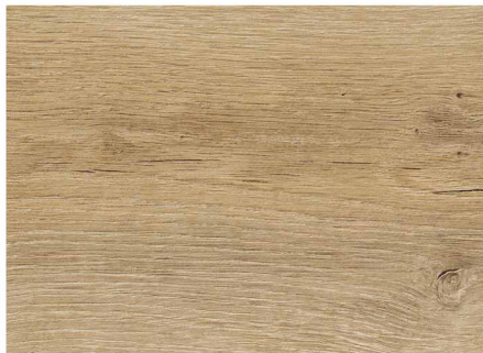
01C52349 / 香檳棕橡木