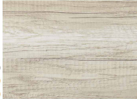
01C52346 / 象牙灰橡木